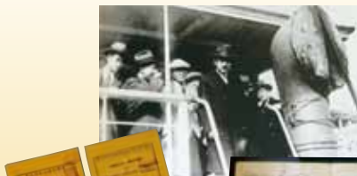
シベリア經由 欧亜国際連絡列車切符

開…9時～17時 休…年末年始(12月29日～翌年1月3日) ☎…0770・37・1035