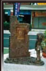
3 少年 星野鉄郎