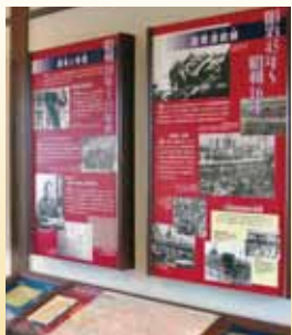
敦賀ムゼウム内展示

開…9時～17時 休…年末年始(12月29日～翌年1月3日) ☎…0770・37・1035