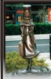
16 メーテルとの出会い