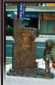
15 少年 星野鉄郎