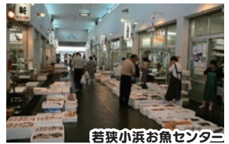
若狭小浜お魚センター